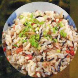
クーブジュシー ジュシーとは炊き込みご飯のこと。 昆布と一緒に炊き込みます。