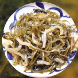
クーバイリチー クーブとは昆布のこと。 昆布を千切りにした炒め物。