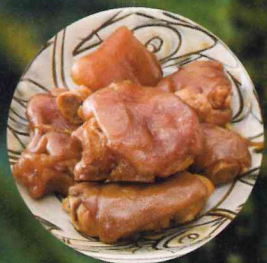
てびち 豚足を昆布と一緒に煮たもの。